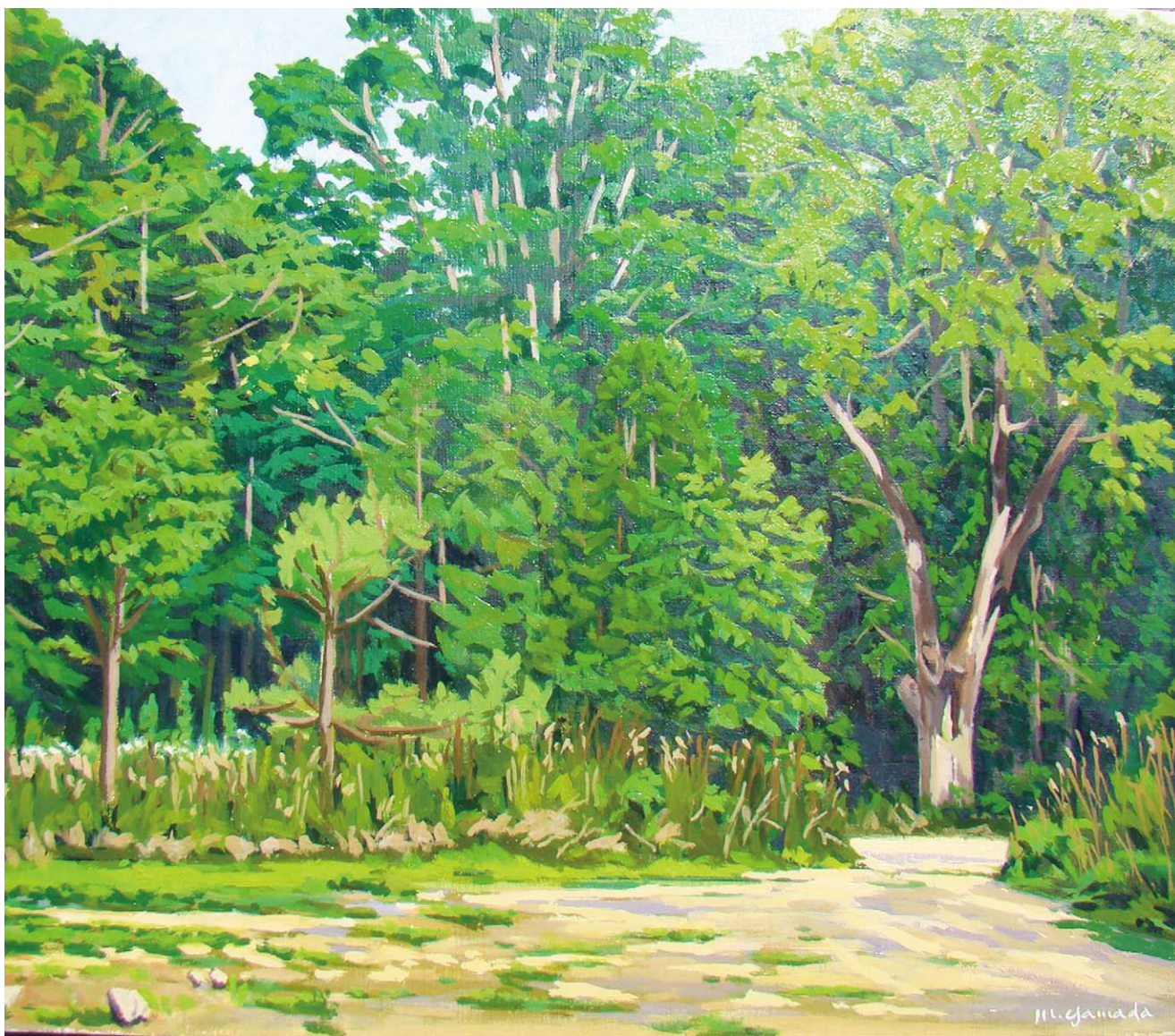
「表題：なえぼ公園」 画：山田 守之