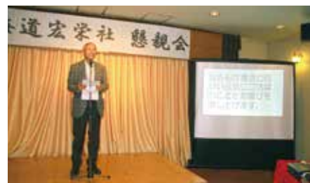
「理事長のあいさつより楽しい宴会がスタート」

利用者さんを中心に職員、パートさんが集まるパーティーで、みんなで歌って飲んで楽しい時間を過ごしました。