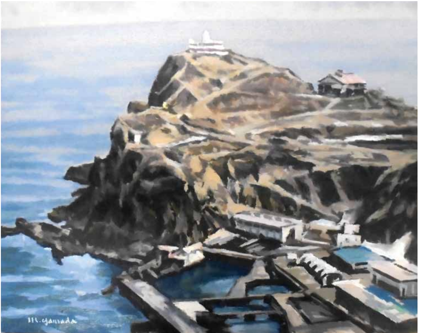
ひょうだい たかしまさき 「表題：高島岬」 え やまだ もりゆき 画：山田 守之