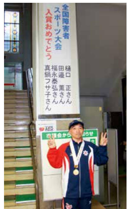
「11月20日(月)おたる市長表敬訪問」